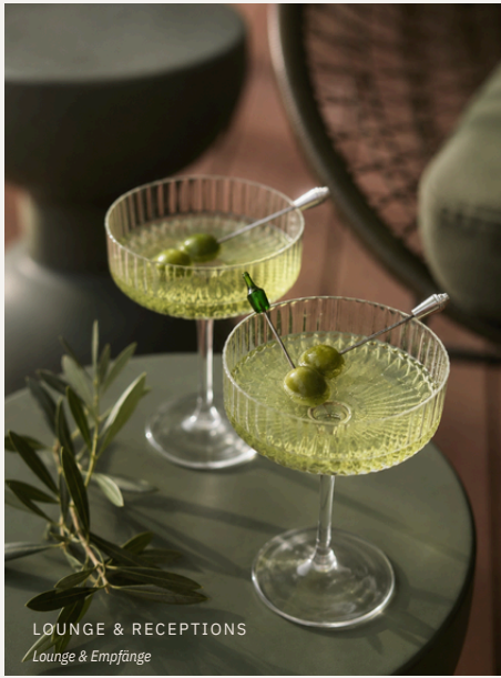
LOUNGE & RECEPTIONS Lounge & Empfänge

Urbanes Refugium für kuratierte Erlebnisse