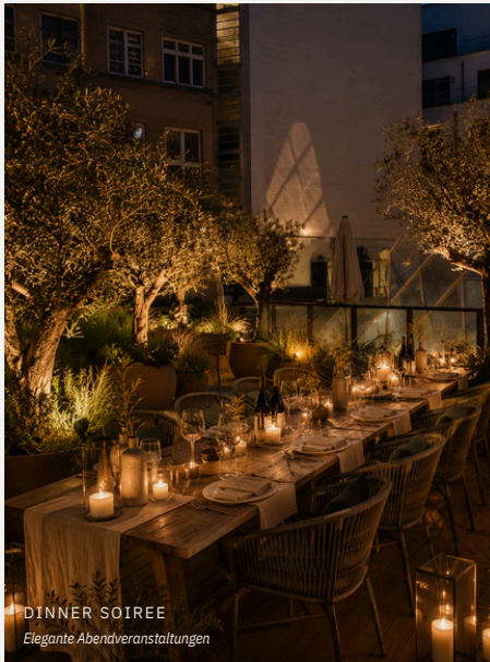
DINNER SOIREE Elegante Abendveranstaltungen