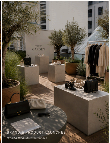
BRAND & PRODUCT LAUNCHES Brand & Produktpräsentationen

Right in the heart of the city, a space is taking shape that blends tranquility, design, and atmosphere. CITY GARDEN is a curated outdoor venue for modern brand experiences, intimate events, and extraordinary gatherings.