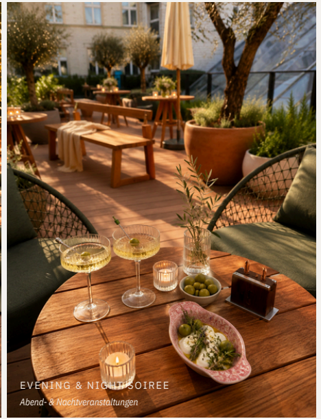
EVENING & NIGHT SOIREE Abend- & Nachtveranstaltungen