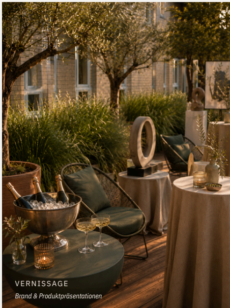
VERNISSAGE Brand & Produktpräsentationen