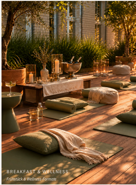
BREAKFAST & WELLNESS Frühstück & Wellness-Formate